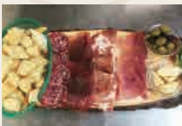
Affettato misto con gnocchi fritti e formaggio