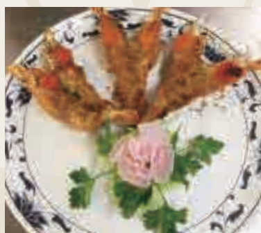
Aragostelle* gratinate con patate al forno €16.00