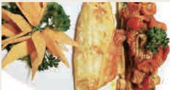
Paccheri con filetto di branzino e pomodorini €12,00