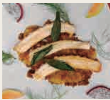
Polpo* al griglia sul patate gratinate €14,00