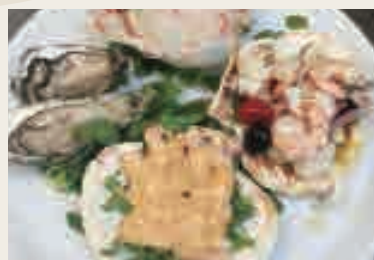
Antipasti di pesce del casa