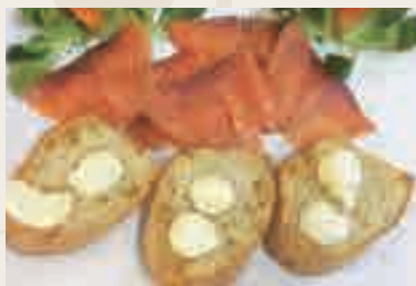
Bruschette al burro e salmone