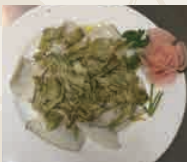
Tagliata di branzino con carciofi freschi €14,00