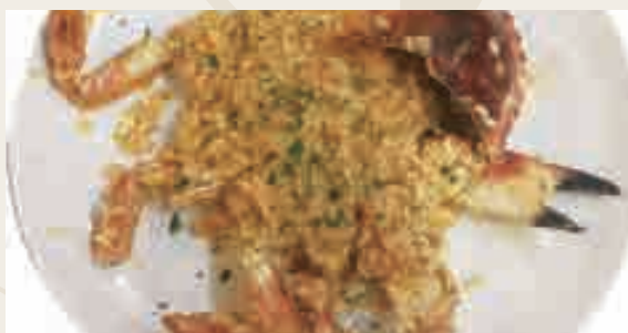
Risotto con Granchio* e crema di gamberi* €12,00