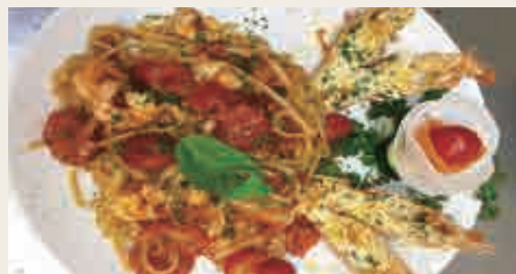
Spaghetti con aragostella* e gamberetti* €15,00