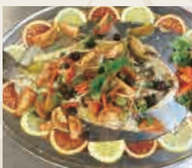
Branzino al ligure (branzino intero al forno secca con pomodoro fresco, capri, olive, basilico) €15,00