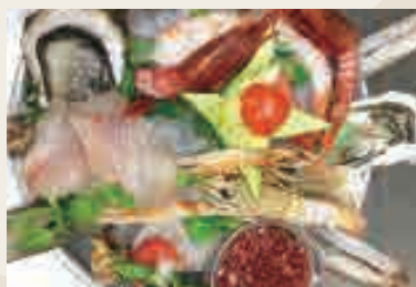
Pesce misti crudi [ ostriche, scampi*, gamberoni* rossi siciliani, ecc.]