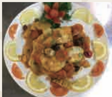
Pescatrice* con carciofi e patate e olive rivera €15.00