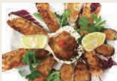
Pesce misto gratinate