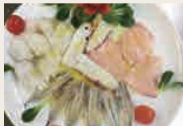
Pesce* misti marinato