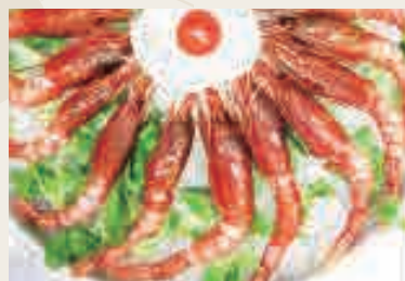
Gamberoni* rossi siciliani crudi [ 6 pezzi ]