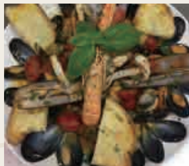
Zuppa di pesce con crostini €15,00