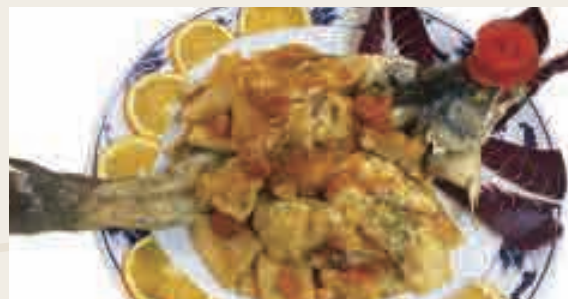
Paccheri con branzino intero con pomodorini (branzino da 1kg circa a tagliata per 2persone)