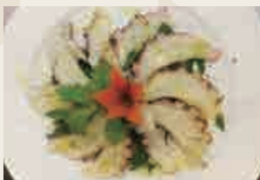
Carpaccio di polpo* ( polpo cotto ) con rucola al limone