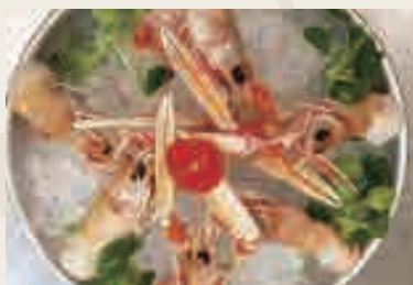
Scampi* crudi [ 6 pezzi ]