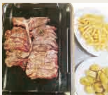
Tagliata di Fiorentina alla pietra ollare con contorni (pietra ollare caldo vivo a tavola, min 2persone ) €45,00

*alcuni prodotti possono essere surgelati.