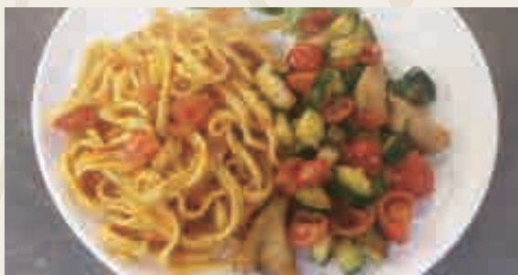
Scialatielli con pesce spada* e zucchine €12,00