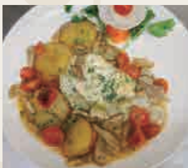
Filetto di rombo con porcini e pomodorini €14.00