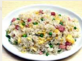
Riso alla cantonese€5,00