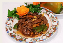
Vitello in salsa piccante * €7,00