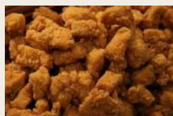
Pollo fritto * €6,00