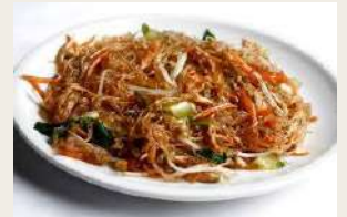
Spaghetti di soia con verdure miste €6,00