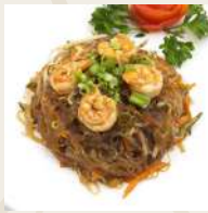
Spaghetti di riso con gamberi * €7,00