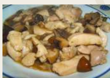
Pollo con bambù e funghi *€6,00