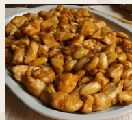
Pollo con mandorle *€6,00