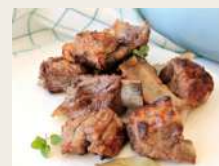
Puntine di maiale fritti* €6,00