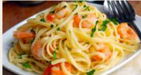
linguine con gamberi*€7,00