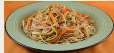
Spaghetti di riso con verdure miste €6,00