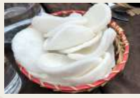
nuvole di drago €3,00