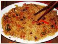
Spaghetti di soia con carne tritata piccante €6,00