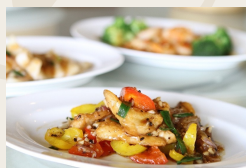
Pollo in salsa piccante€6,00