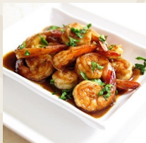
Gamberi in salsa piccante * €7,00