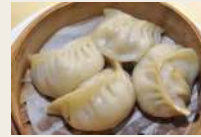
Ravioli di carne al vapore* €5,00