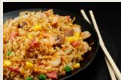
Riso saltato €6,00