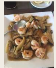
Gamberi con bambù e funghi*€7,00