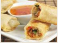
involto primavera €2,50