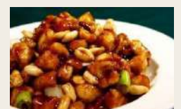
pollo in salsa gon bao €6,00