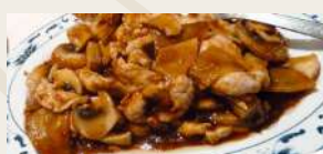
Vitello con bambù e funghi * €7,00